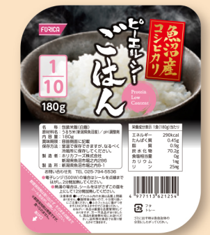
ピーエルシーごはん1/10魚沼産コシヒカリ