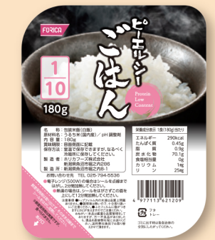
ピーエルシーごはん1/10