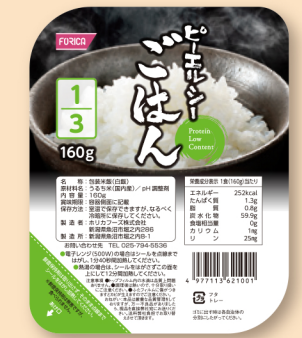
ピーエルシーごはん1/3