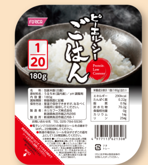
ピーエルシーごはん1/20