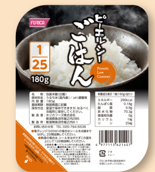
ピーエルシーごはん1/25