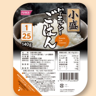
ピーエルシーごはん1/25小盛