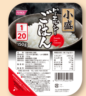
ピーエルシーごはん1/20小盛